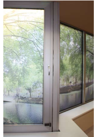
Fensterfolien bieten an den Flurenden zusätzlichen Sichtschutz. Die langen Fensterfronten zum Innenhofbereich werden so mit in das Gesamtkonzept integriert.

Eine ganz besondere Flexibilität bieten 14 der neuen Zimmer. Acht von ihnen können durch Verbindungstüren in vier Connecting Rooms verwandelt werden, die auch höchstem Raumbedarf gerecht werden. Sechs weitere Gästezimmer wurden als sogenannte „Murphy Rooms“ angelegt und mit modernster Konferenzraumtechnik ausgestattet. Das Bett kann man für eine Konferenz im Wandschrank verschwinden lassen. Ansonsten ist das Zimmer ebenso komfortabel wie die anderen Executive-Räume. Zusammen mit den Murphy Rooms verfügt das hotel nikko düsseldorf damit über nunmehr 18 Konferenzräume und bietet auf 2000 m 2 Veranstaltungsfläche Platz für bis zu 1000 Teilnehmer.