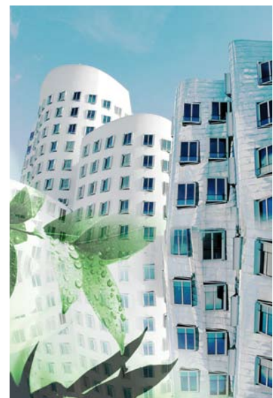
Farblich angepasste Collagen verleihen den Bädern eine frische Note.