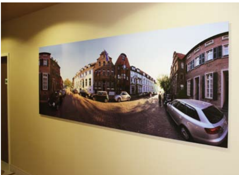
Die artbonds in den Korridoren schaffen einen regionalen Bezug und sind für die Gäste echte Hingucker.